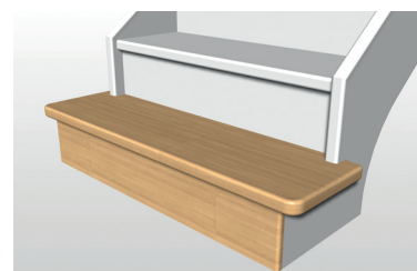
marche départ D1-2