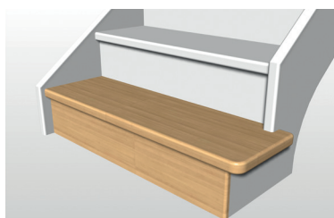
marche départ D1-1