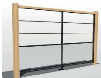
2 lisses + soubassement verre