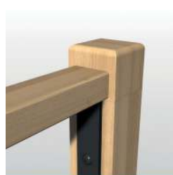
MC bois rectangulaire 52x33mm