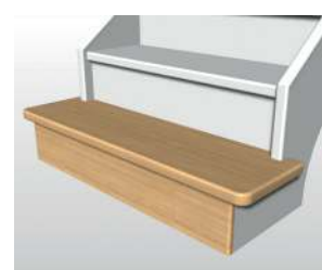
Marche départ D1-2