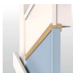
Lisse sous limon pour cloison