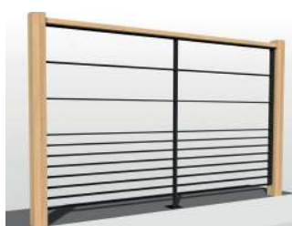
2 lisses + soubassement 7 lisses