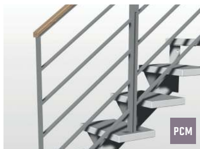
5 lisses métalliques