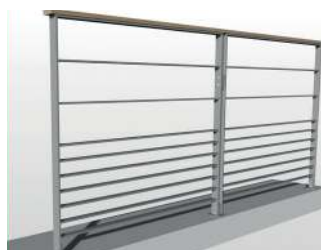
2 lisses + soubassement 7 lisses