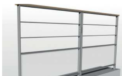
2 lisses + soubassement verre