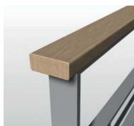
MC bois rectangulaire 50x20mm