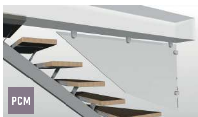
sur poutre centrale métallique