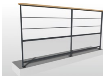
2 barres + soubassement verre