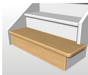
Marche départ D1-1