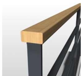
MC bois rectangulaire 52x25mm