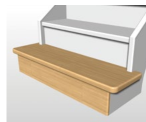
Marche départ D1-2