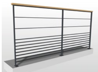
Lisses toute hauteur